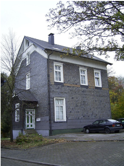
Schule in Neuenholte (2007)