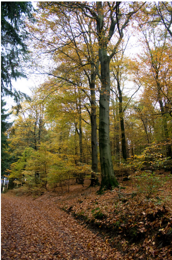
Hohlwegbündel entlang der Trasse der Heidenstraße (2013)