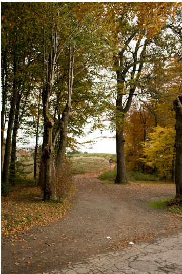
Kümmeler Kreuz an der Kreuzung der Heidenstraße und der Wegeverbindung zwischen Kümmel und Leiberg (2013)