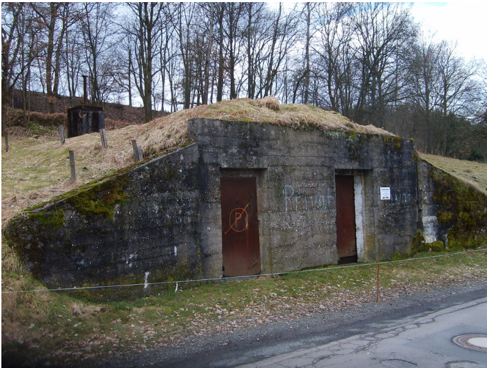
Werkschutzbunker Ommer&Gabske in Wipperfließ (2009)