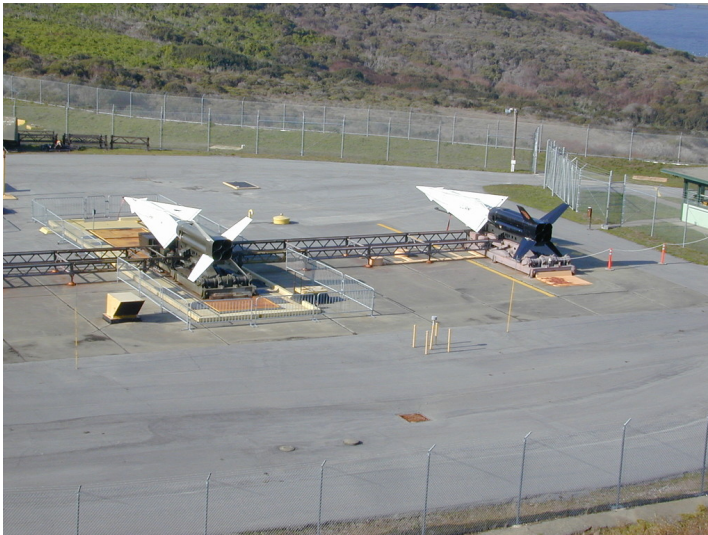
Zwei US-amerikanische Langstrecken-Flugabwehrraketen des Typs "Nike Hercules", die auch als taktische Nuklearwaffen eingesetzt werden konnten (2004)