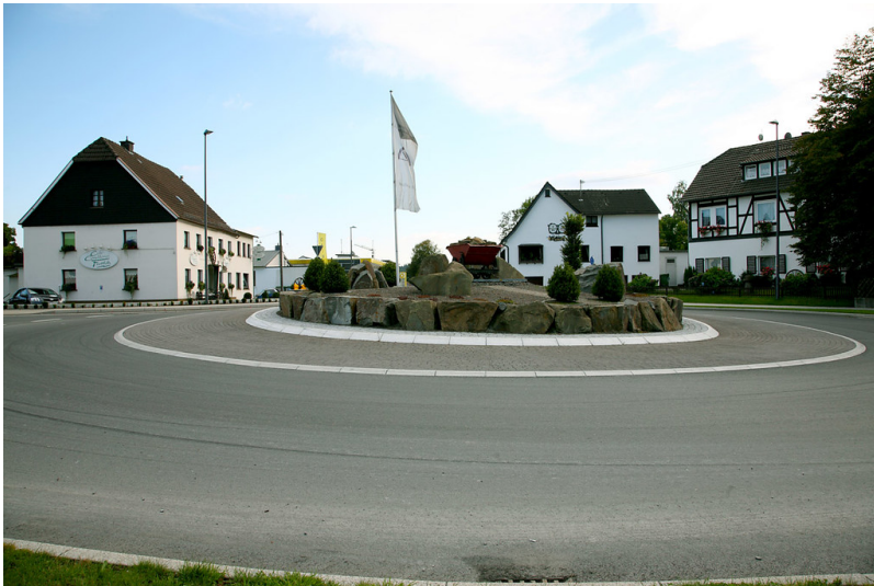
Verkehrsknotenpunkt an der Alten Bergischen Eisenstraße mit den ehemaligen Raststätten für Fuhrleute und der evangelischen Schule in Marienheide-Rodt (2008)