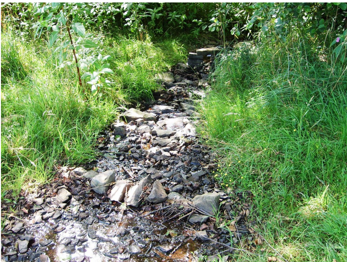
Die Wipper im Bereich ihrer Quelle bei Börlinghausen (2009).