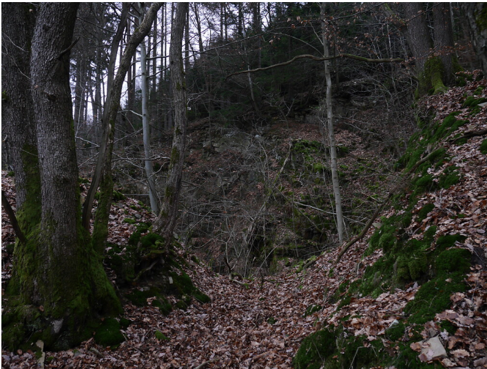
Steinbruch Erlinghagen. (2018)