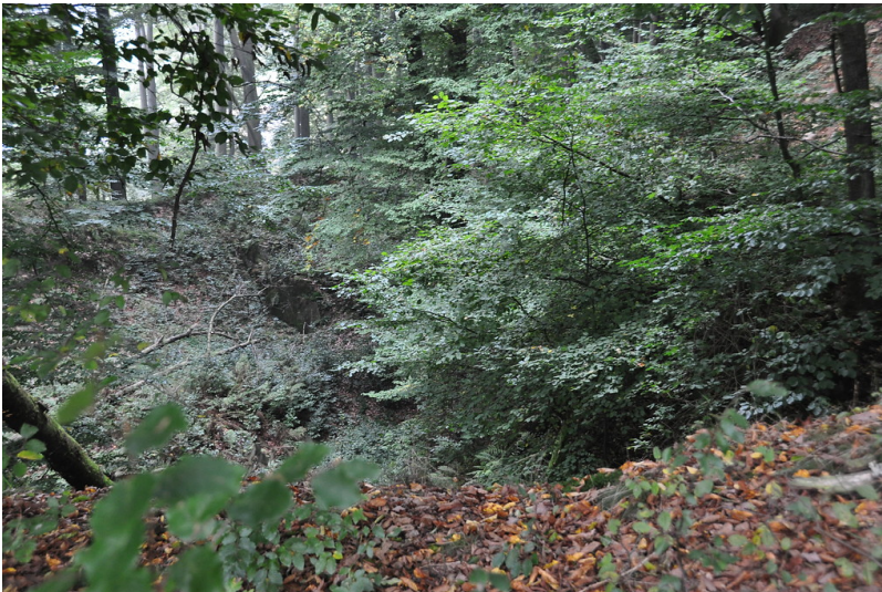
Abbaukanten und Abraumphalden des Kalksteinbruches bei Vordermühle (2013)