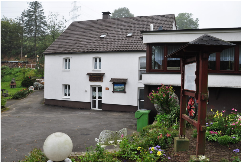
Mühlengebäude und die Bäckerei der ehemaligen Getreidemühle in Vordermühle (2013)