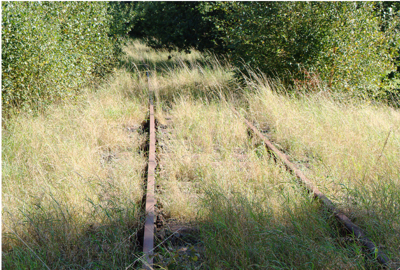
Trasse der Bahnlinie Wipperföhrth - Lennep bei Busenbach (2007)