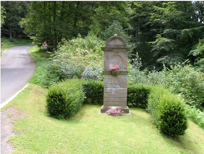
Kreuzwegstation in Gimborn an der Straße nach Erlinghagen (2009)