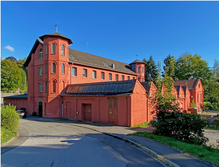
Die ehemalige Tuchfabrik Arnold Hueck & Cie in Hückeswagen (2021)