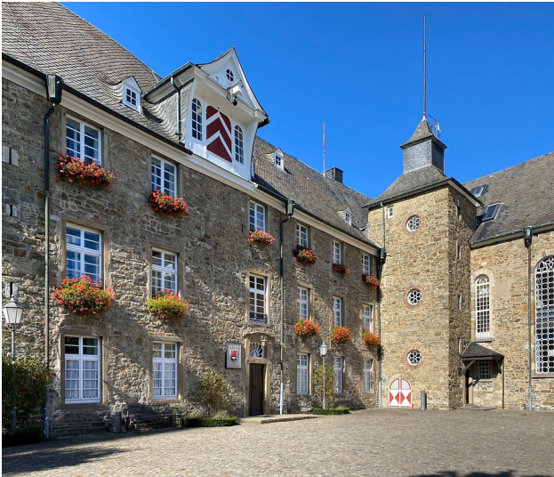
Das Schloss Hückeswagen in Hückeswagen (2021)