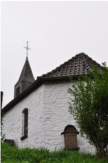
Rückseite der Kapelle in Vordermühle mit einer Kreuzwegstation (2013)