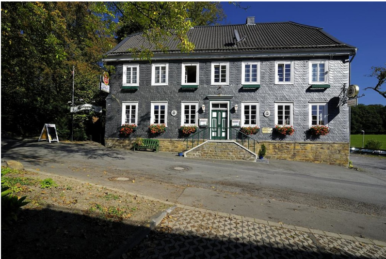
Haus Berger in Thier (2011)