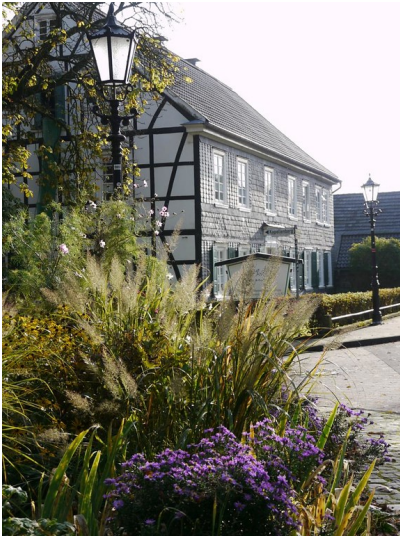
Bauernhaus Berger in Thier (2013)