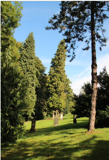
Blick auf den im Jahr 1795 westlich der Kirche terrassenförmig angelegten historischen Friedhof in Wipperfürth-Thier (2013).