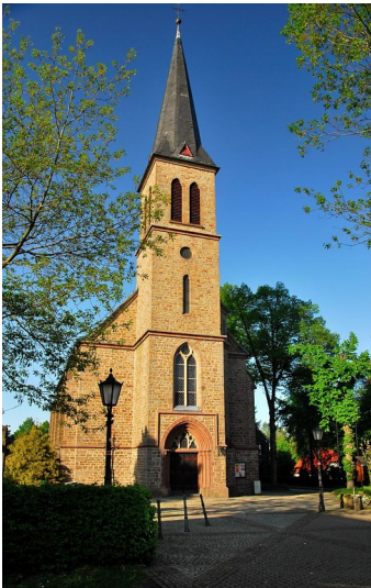
Katholische Kirche St. Anna in Wipperfürth-Thier (2011)