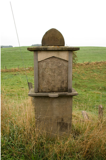
Denkmalgeschützter Bildstock im Norden Bühlstahls (2013)