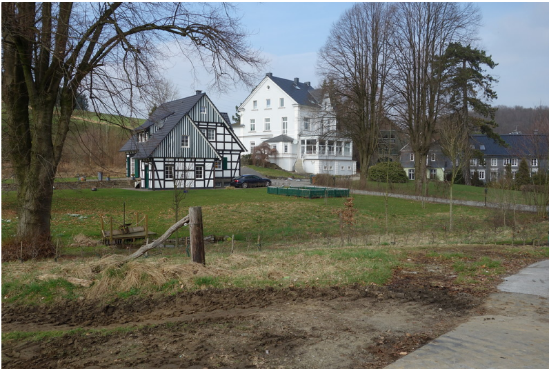
Weiße Villa (2017)