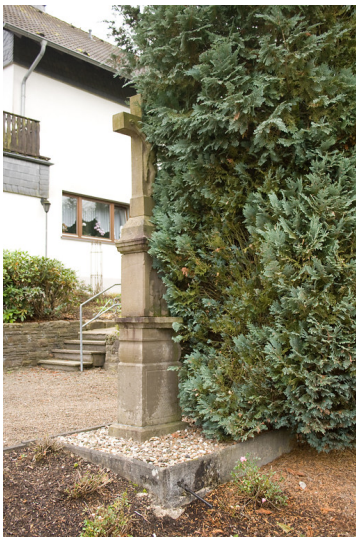
Denkmalgeschütztes Wegekreuz in Klemenseichen (2013)