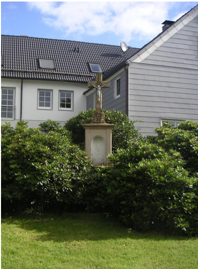
Wegekreuz in Beinghausen (2008)