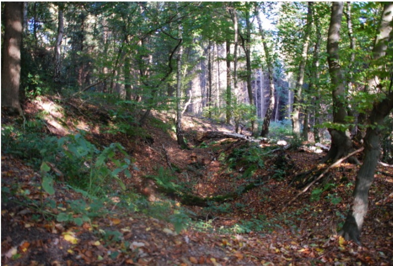
Tagesbrüche Stollenzeche Nachtigall in Byfang