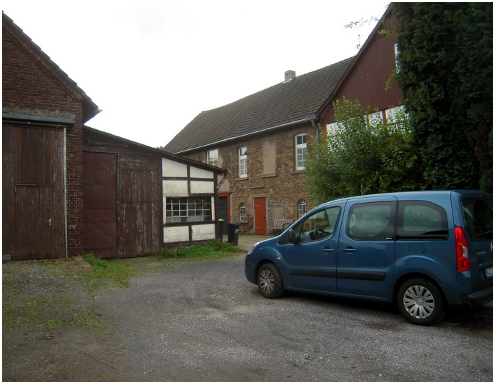
Gebäude der ehemaligen Dampfmühle Scheele in Essen-Burgaltendorf (2016)