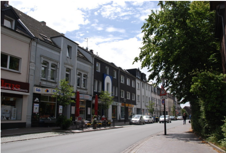
Die Bahnhofstrasse in Essen-Heisingen (2009).