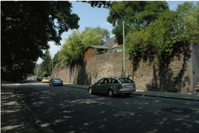
Klapperstrasse in Überraehr-Holthausen (2009)