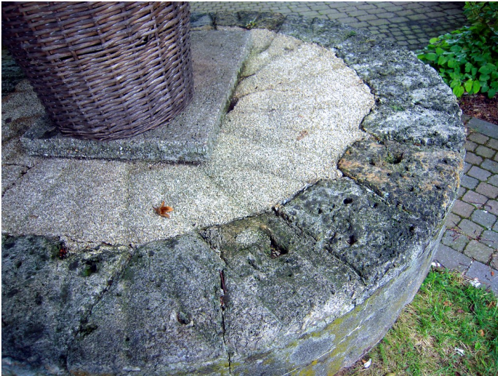
Mosaikstein der ehemaligen Dampfmühle Scheele in Essen-Burgaltendorf (2016).