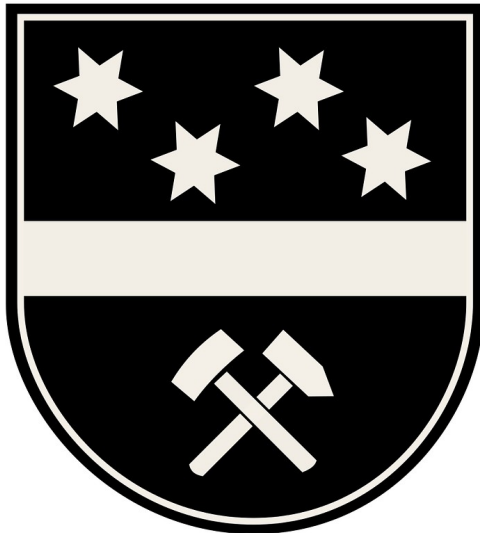
Das Wappen der Stadt Hückelhoven im Kreis Heinsberg.