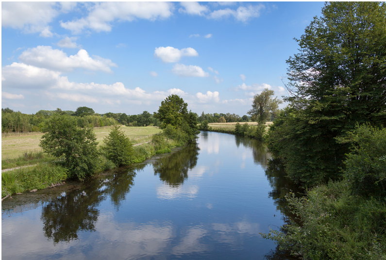
Inden-Schophoven, Rur, Landschaftsaufnahme