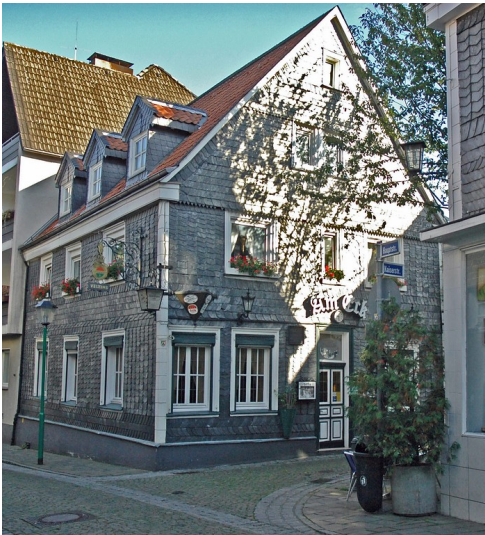
Gasthaus "Am Eck" in der Kaiserstraße 2 in Essen Kettwig