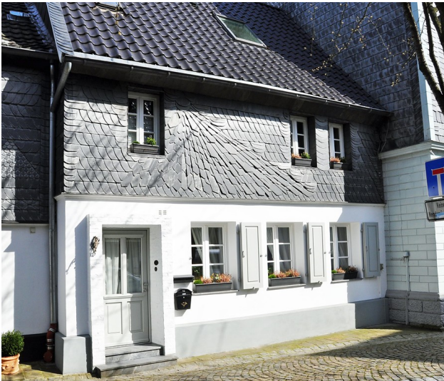
Wohnhaus Kaiserstraße 15 in Essen Kettwig