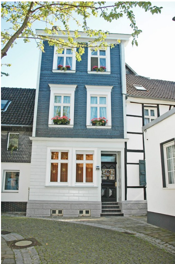
Wohnhaus Kaiserstraße 11-13 in Essen Kettwig