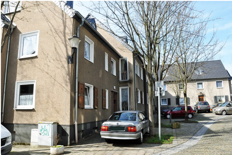
Wohnhaus Kaiserstraße 24 in Essen Kettwig