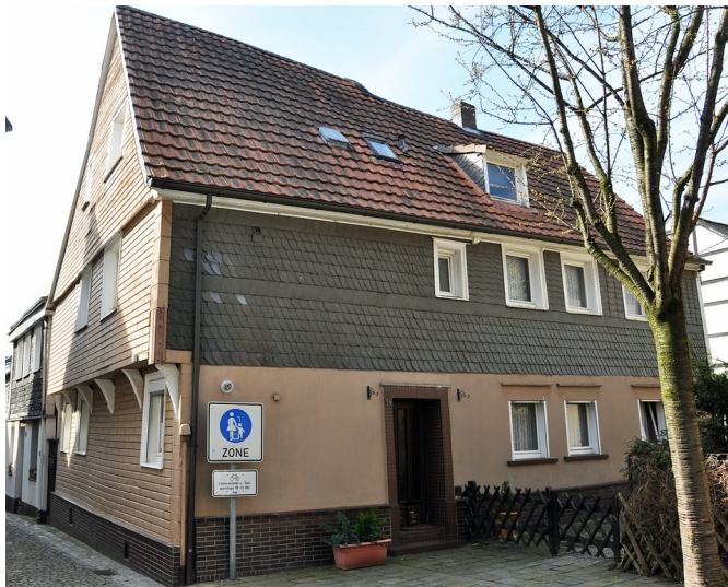
Fachwerkwohnhaus Kaiserstraße 12 in Essen Kettwig