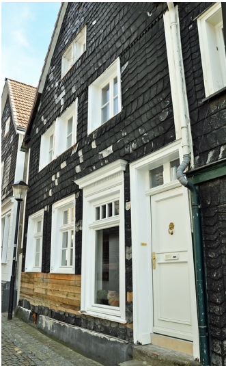
Fachwerkwohnhaus Kaiserstraße 7 in Essen Kettwig