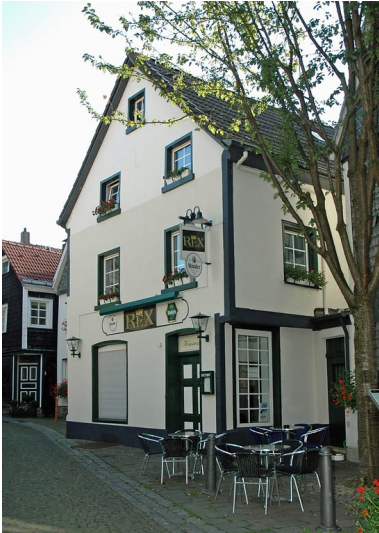
Gasthaus "Kaiserstube", Kaiserstraße 1, Essen Kettwig