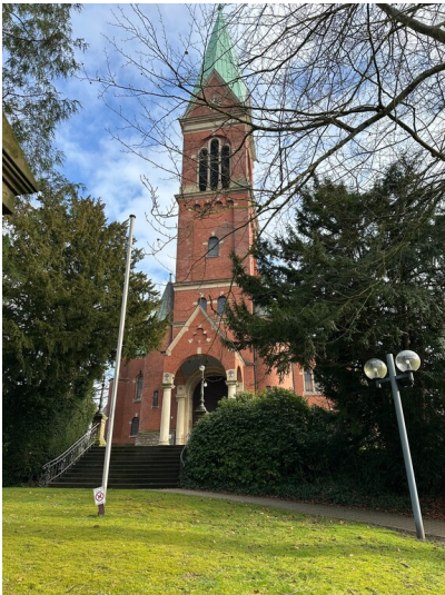
Evangelische Kirche in Essen-Werden (2025).