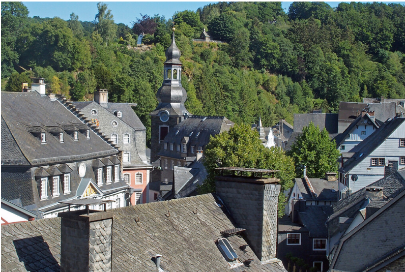
Evangelische Stadtkirche Monschau (2022)