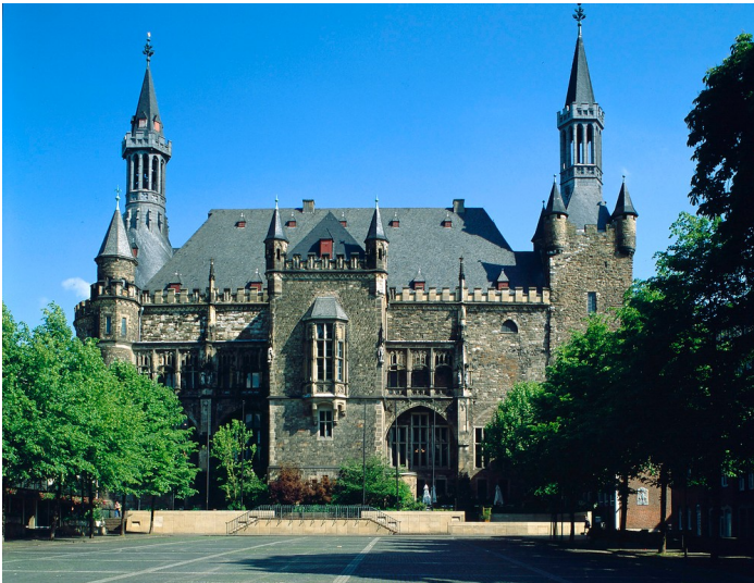
Das Aachener Rathaus vom Katschhof aus gesehen (1999).