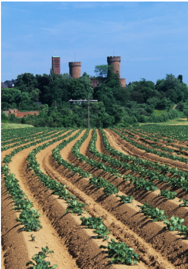
Blick auf die Stadttürme von Zülpich, Kreis Euskirchen (2007)