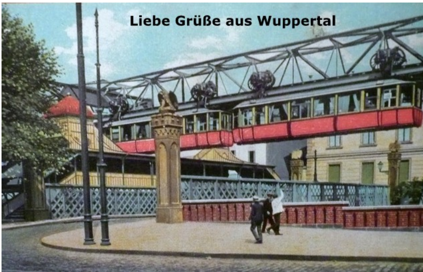
Historische Postkarte mit der Wuppertaler Adlerbrücke und einen Zug der Schwebebahn, der entlang der Wupper die Brücke kreuzt (undatiert).