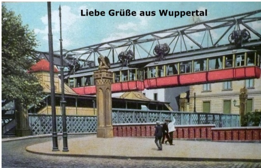
Historische Postkarte mit der Wuppertaler Adlerbrücke und einen Zug der Schwebebahn, der entlang der Wupper die Brücke kreuzt (undatiert).