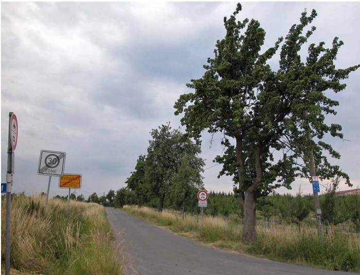
Sicht auf die Fritzdorfer Windmühlenstraße mit der "Birnenallee" (2011)

Bundesland: Nordrhein-Westfalen, Rheinland-Pfalz