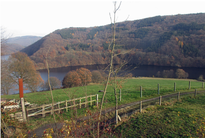
Blick auf den Stausee der Rurtalsperre bei Simmerath-Rurberg (2016).