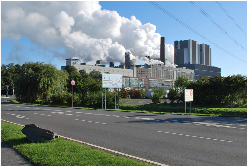
Braunkohlkraftwerk Weisweiler (RWE) mit den zwei jüngsten Kraftwerksblöcken von 2006 (2015)