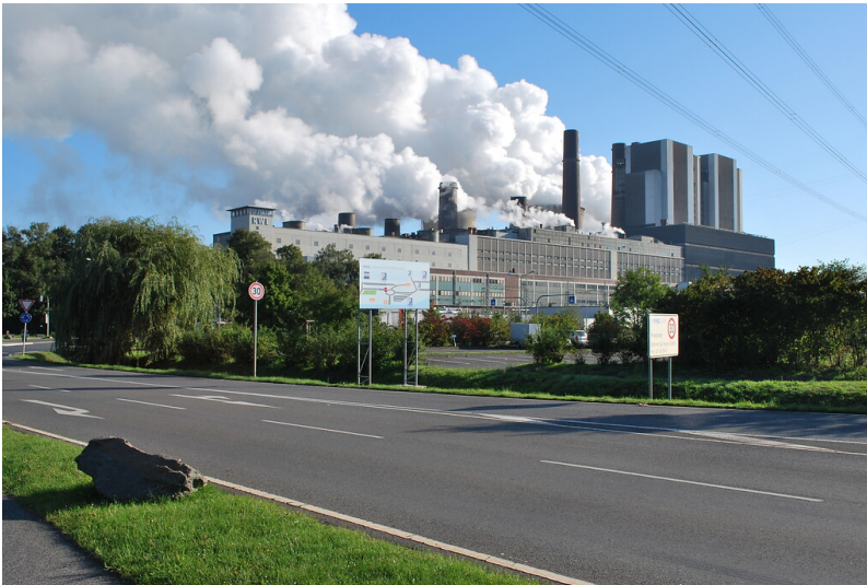
Braunkohlekraftwerk Weisweiler (RWEL) mit den zwei jüngsten Kraftwerksblöcken von 2006 (2015)