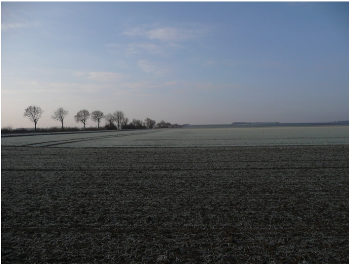
Von Bäumen begrenzte Agrippa-Straße zwischen Erftstadt und Zülpich (2009)