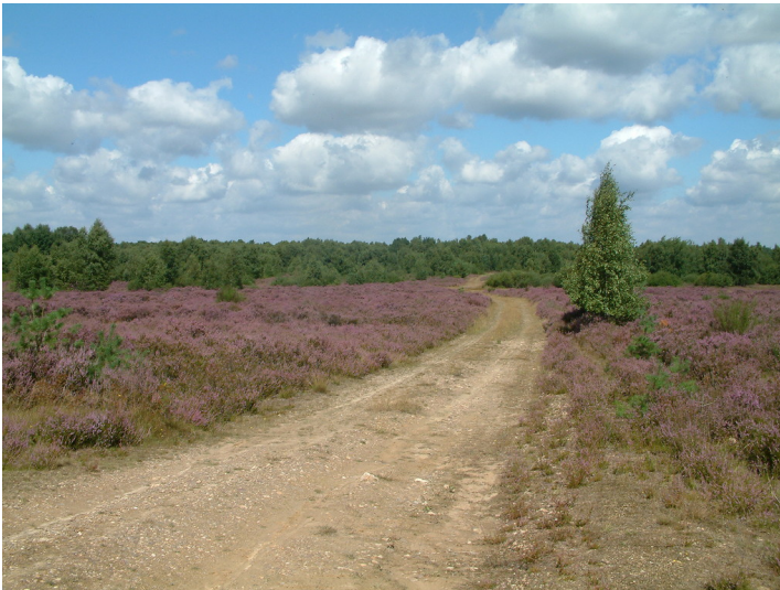
Wanderweg in der Drover Heide zur Zeit der Heideblüte (2007)