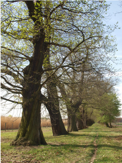
Kastanienallee bei Schloss Dyck, Jüchen (2010)