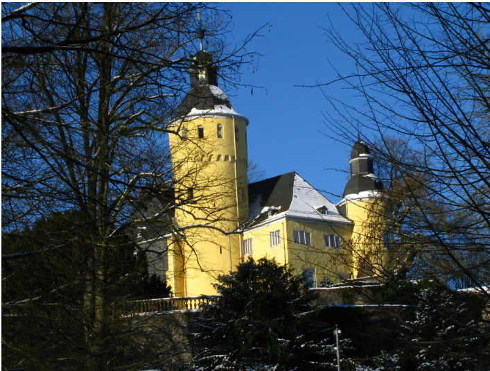
Schloss Homburg bei Nümbrecht mit seinen zwei Türmen inmitten des Schlossparks (2009).